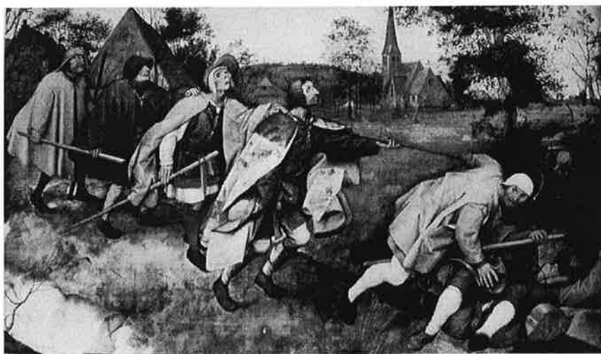
Pieter Bruegel il Vecchio, La parabola dei ciechi, Olio su tela, 1568 (Museo di Capod monte, Napoli)

ai diritti. Nonostante le apparenti divergenze e la discordanza delle due visioni citate, queste finiscono dunque per convergere su una lettura culturalista dell'immigrazione, a scapito della valenza sociale dell'esperienza migratoria.